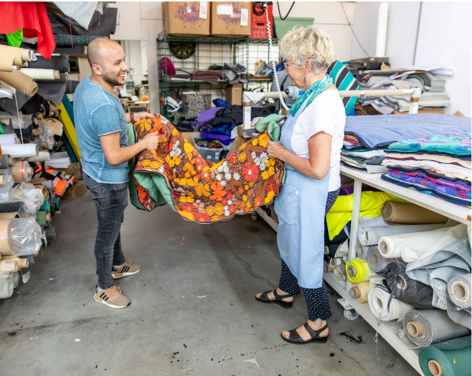
Upcycling van slaapzakken

In totaal hebben we in dit verslagjaar 65.223,5 kg restmateriaal geüpicycled. Tijdens de productie van de Sheltersuits is onder andere gebruik gemaakt van oude slaapzakken. Deze slaapzakken zijn via kringloopwinkels en festivals als Zwarte Cross, Tomorrowland en Pinkpop ingezameld. Dankzij Miele, die meerdere wasmachines en drogers bij ons heeft geplaatst, zijn we in staat om de slaapzakken te wassen.